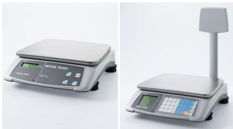
bRite, version pesage seul