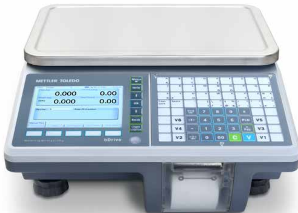
Balance compacte bDrive

Effectuant des pesées rapides et précises, le système bDrive de METTLER TOLEDO est une balance de comptage polyvalente multifonctions avec imprimante ticket, destinée à un usage en magasin ou en itinérance. Se démarquant par sa rapidité et sa robustesse, la bDrive effectue des processus de pesage complets et performants qui réduisent les temps d'attente des clients, même dans les environnements difficiles.