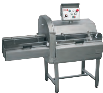
Slico 650 avec porte fixe Slico 650 with fixed door