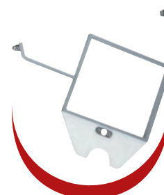
Contre couteau démontable Demountable counter knife