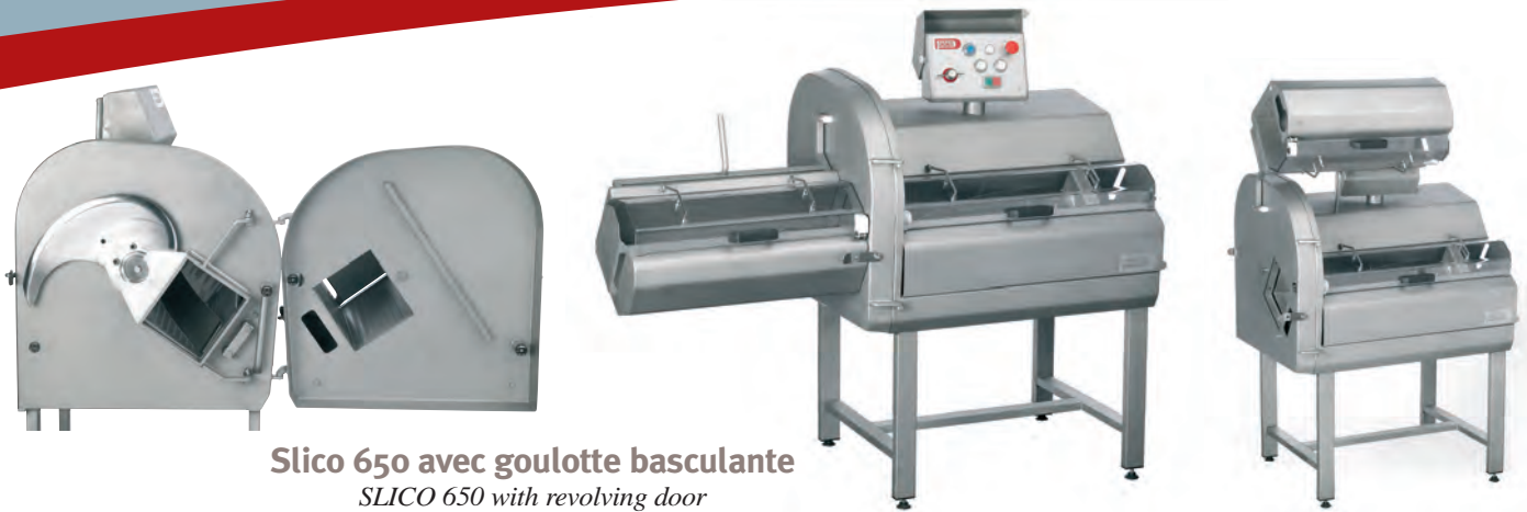
Slico 650 avec goulotte basculante SLICO 650 with revolving door