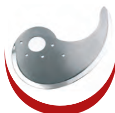
Couteau lisse ou semi cranté Smooth and semi sawtoothed knives