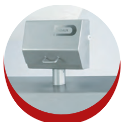
Coffret protégé Protection of panel