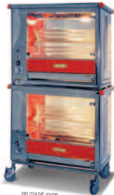
RB 224 NE rouge

Rôtissoire à balancelles, elle concilie simplicité et automatisme. Conçue pour vous faciliter la vie et vous faire gagner du temps, elle est efficace, polyvalente et fiable. Entièrement démontable elle se nettoie en un tour de main... bref, une petite perle rare!