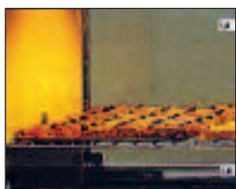
Configuration grille (four)