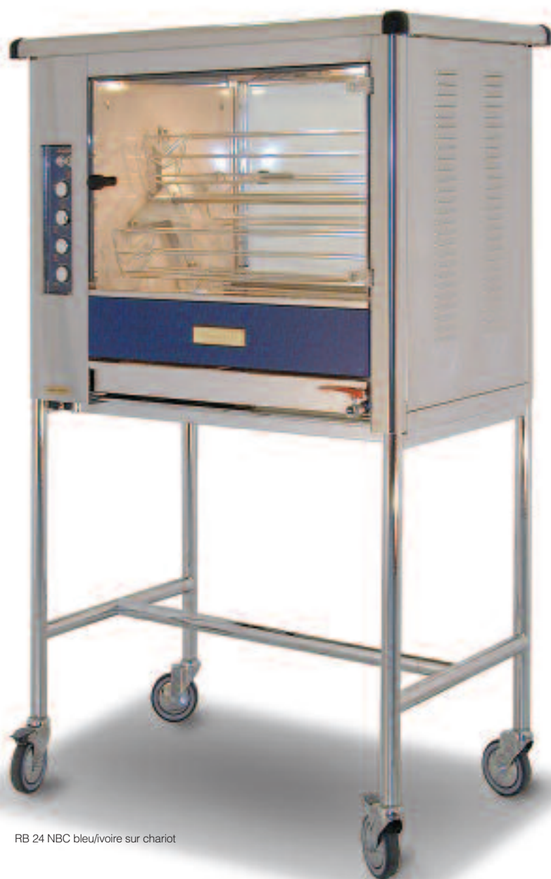
RB 24 NBC bleu/ivoire sur chariot

La toute petite, bonne à tout bien faire !