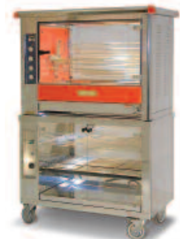
RB 16 NBC rouge sur étuve EB16