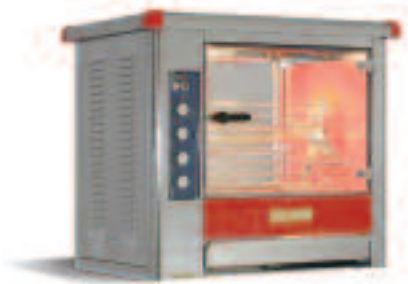
RB 12 NBC rouge