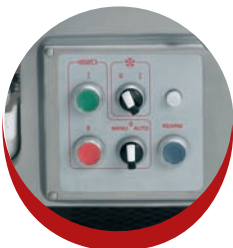
Tableau de commande parfaitement étanche