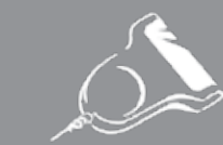
Scanner (alimenté par la balance)